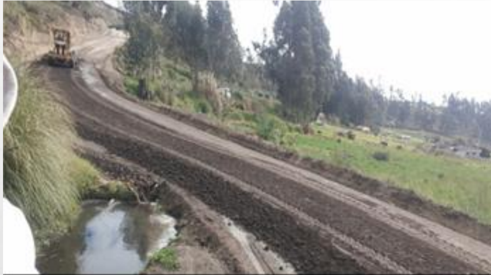
Unnamed Road, Ambato, Ecuador