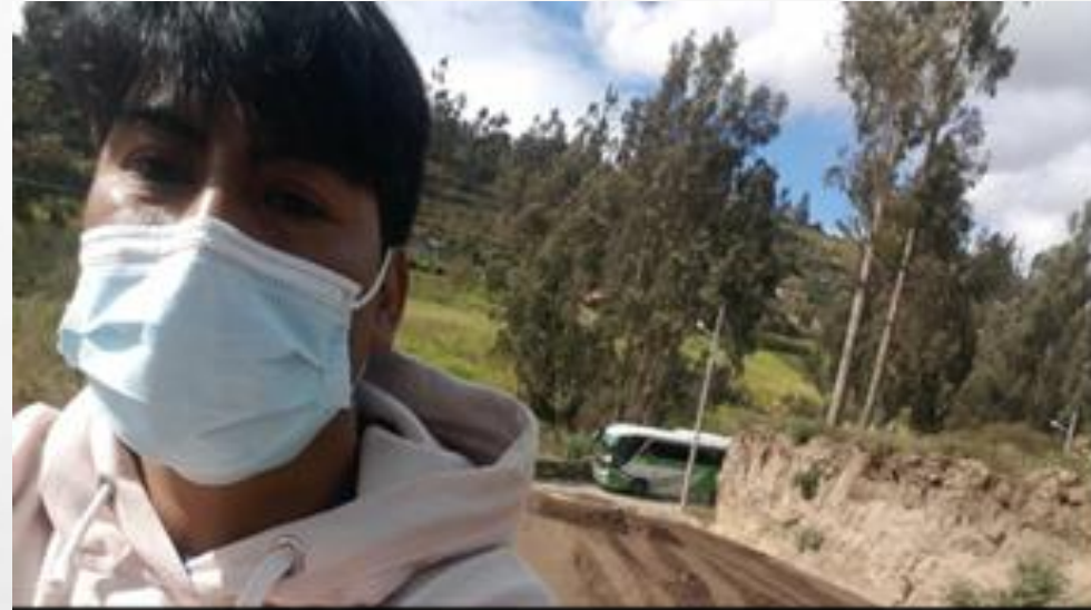
Unnamed Road, Ambato, Ecuador